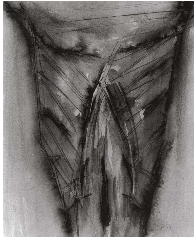
De la série Christs