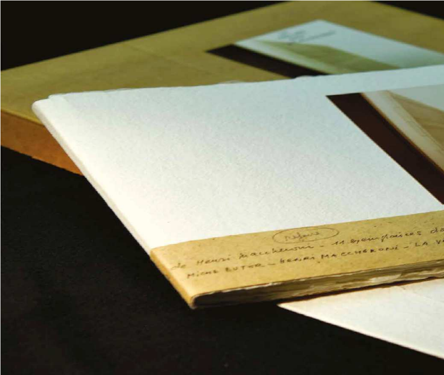
Ouvrage La vallée des dépossédés , oeuvre croisée avec Michel Butor.