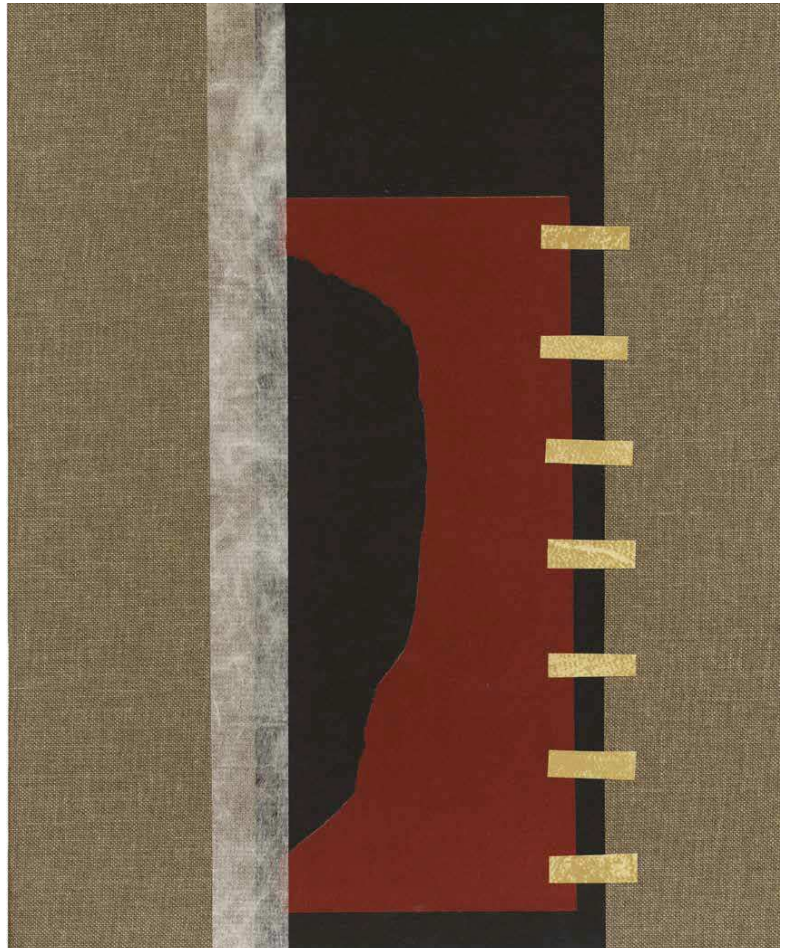
Couverture du livre Crâne avec Pierre Bourgeade