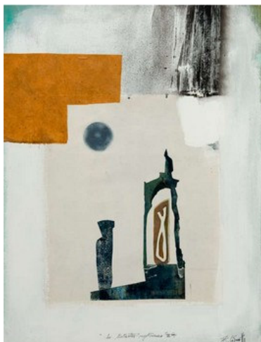
Les statuettes mystérieuses II. Philippe Césaretti. 2005