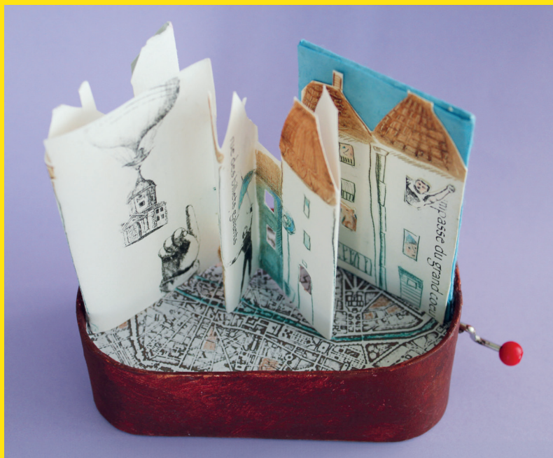
Frédérique Le Lous Delpèch - Quartier des baisers ardents . Coll. Bibliothèque Municipale à Vocation Régionale de Nice